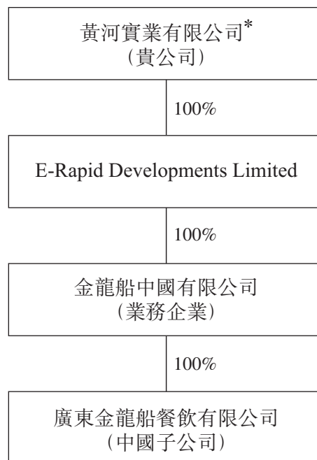
圖1：業務企業於緊接出售建議完成前之股權架構

據告知，業務企業現為 貴公司全資擁有子公司。業務企業於緊接出售建議完成前之股權架構如下圖所示：